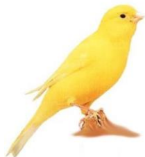
Gul Lipokrom intensiv Farvekanarie

Når der er flere hundrede varianter, lyder det noget uoverskueligt, men faktisk er det ikke så slemt, for alle de forskellige varianter kan samles i 11 hovedserier, der benævnes som: Sort-serien. Agat-serien. Brun-serien. Isabel-serien. Mosaik-serien. Lipokrom-serien. Phæo-serien. Satinet-serien. Topaz-serien. Eumo-serien. Onyx-serien. Alle de forskellige deles så igen i to hovedgrupper der benævnes ”Intensiv” og ”Rimet”. Det er to udtryk man ofte vil støde på, når snakken drejer sig om kanarier. På billederne her nedenunder vises de to former, hvor begge de gule er intensive fugle hvilket vil sige at farven når helt ud i spidserne på fjerene. Den røde fugl er en typisk rimet fugl, hvor man kan se at den er dækket af et lyst slør lige som en gang rimfrost, det skyldes at farven ikke når helt ud i spidserne på fjerene. Normal sam-