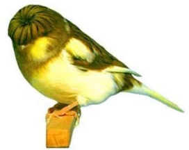
Gloster Corona Toppede-racer