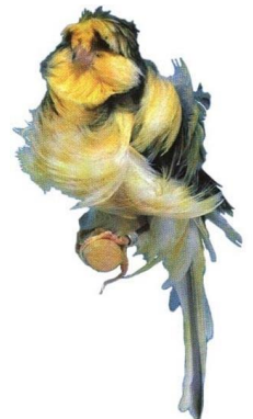
Pariser Frise' Friserede-racer