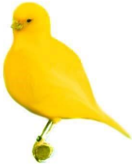
Border Fancy Form-racer

Billederne herunder viser kanarier fra de seks forskellige hovedserier.