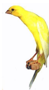
Scotch Fancy Aktions-racer