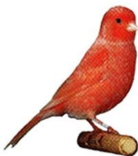
Rød lipokrom rimet Farvekanarie