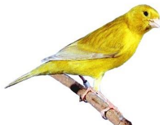
Isabel gul intensiv Farvekanarie